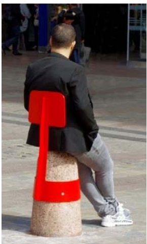
2 / C - Boll Adrien Blanc, 2008