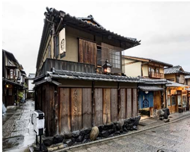
11 / Taichi Yamamoto, Extérieur et intérieur d'un café, Kyoto, 2017.