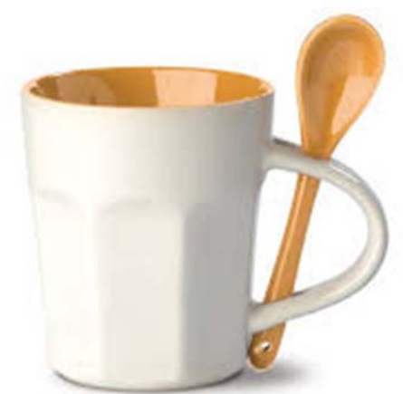
9 / Mug avec cuillère

g) Expliquer la nouvelle fonction de ces dispositifs à l'aide d'un verbe.