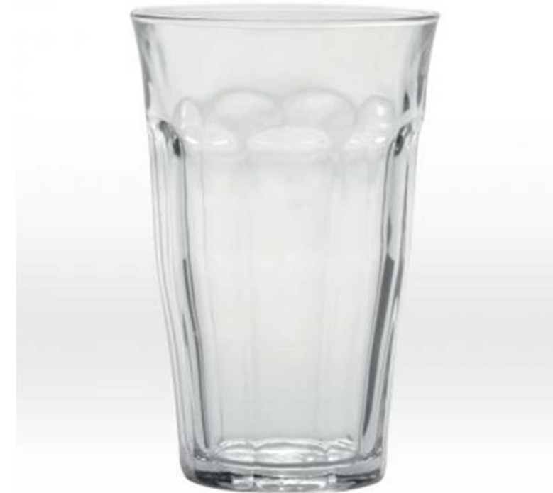
PROPOSITION POUR LE CAFÉ DE KYOTO