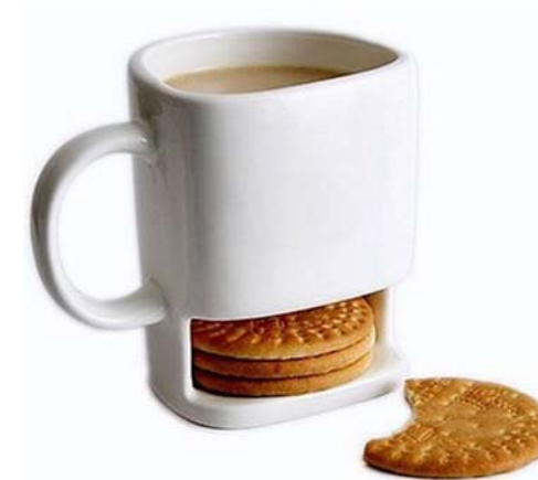
7 / Dunk Mug Mocha Casa

La grande chaîne de cafés internationale souhaite maintenant s'inspirer des exemples ci-dessous pour proposer d'autres fonctions :