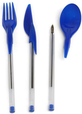
4 / Din Ink Bic Cristal Design Zo Loft, 2015