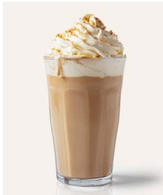
6 / (Source : www.starbucks.com )

Une grande chaîne de cafés internationale décide de servir ses cafés dans le verre Picardie Duralex®. Elle souhaite proposer des compléments d'objet à ce verre afin de lui ajouter les fonctions des emballages jetables.