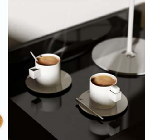
8 / Place au sucre Grrr design, 2008