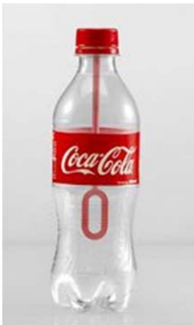
3 / Bouchon Coca-Cola Agence Ogilvy, 2014