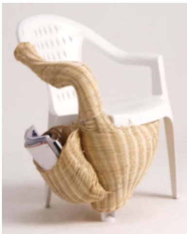
1 / Viminibidi Giulia Cavazzani, 2012