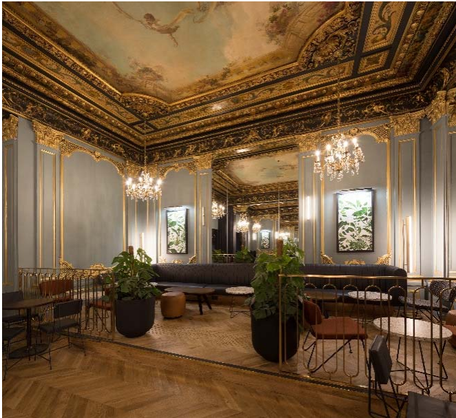
10 / Thierry Della Rovere, Intérieur d'un café, Paris Capucines, 2012. Source : www.starbucks.com

Une grande chaîne de cafés internationale souhaite maintenant s'inspirer des intérieurs de ses cafés pour proposer des compléments d'objet qui s'intègrent à leurs environnements architecturaux.